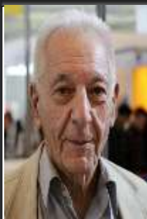
استاد آذرتاش آذرنوش زاده قم، ۱۳۱۶ درگذشت: تهران، ۱۴۰۰ آرامگاه: بهشت زهرا، قطعه نام آوران